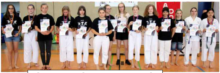
Eiserner Fitness Karateka