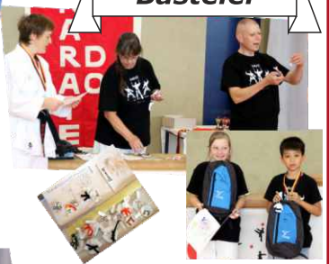
Die schönste Bastelei