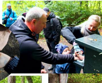
1. Rast an der „Hubertusquelle“ (mit Bienenstich... nicht als Kuchen!) aber das schreckt einen Karateka nicht!

Es war recht kühl und es war Regen vorhergesagt... aber das ließ uns nicht abschrecken! Pünktlich trafen wir uns auf dem Parkplatz am Kloster Michaelstein.