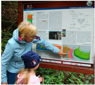
durch herrlich grünen Wald!