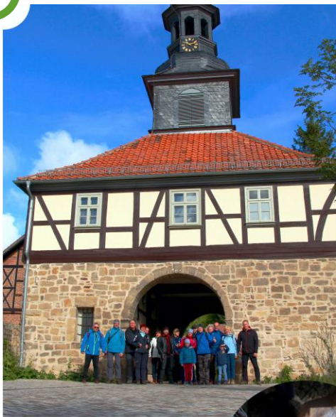
Die Sonne meinte es gut mit uns und so machten wir uns auf den Weg...