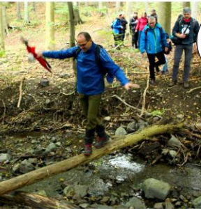
Ich schaffe das sogar mit Mae Geri!