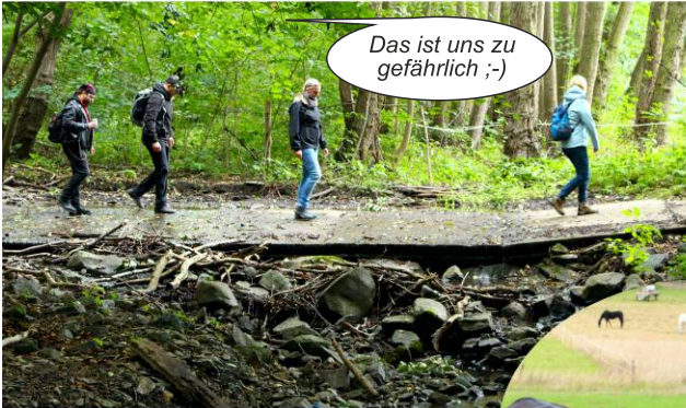
Das ist uns zu gefährlich ;-)