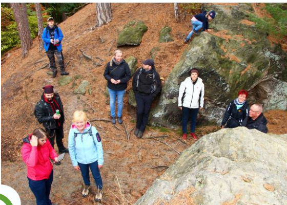
Auf dem Eichhörnchenpfad erklimmen wir den Bärenstein!