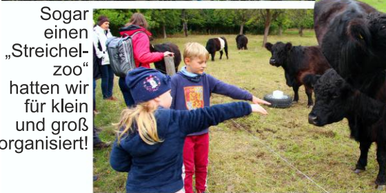
Sogar einen „Streichelzoo“ hatten wir für klein und groß organisiert!